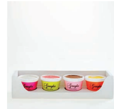
MINI POTS GLACÉS

biscuit dacquoise aux amandes, sorbet framboise, parfait vanille aux éclats d'amandes caramélisées tailles disponibles : 4, 6, 8 pers. allergènes : oeufs, produits laitiers, fruits à coque, gluten