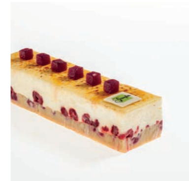
COUP DE SOLEIL*

fond de pâte sablée ,crémeux citron de Menton, guimauves au yuzu, dômes crémeux citron vert/basilic dispo en taille unique 6 pers. allergènes : oeufs, produits laitier, fruits à coque, gluten