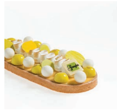
CITRON DE MENTON

biscuit à l'infusion de fèves de Tonka, croustillant spéculos, compotée framboise, crème légère spéculos tailles disponibles : 4, 6, 8 pers. allergènes : oeufs, produits laitiers, fruits à coque, gluten