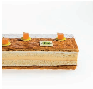
1000 FEUILLES ABRICOT/PASSION

pâte feuilletée pur beurre caramélisée , biscuit cuillère, confit abricot passion, crème intense vanille tailles disponibles : 4, 6, 8 pers. allergènes : oeufs, produits laitiers, gluten