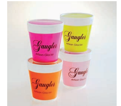
POTS DE GLACES ET SORBETS

glaces et sorbets variés 12€ - la boîte de 4 mini pots allergènes : oeufs, produits laitiers, sans gluten